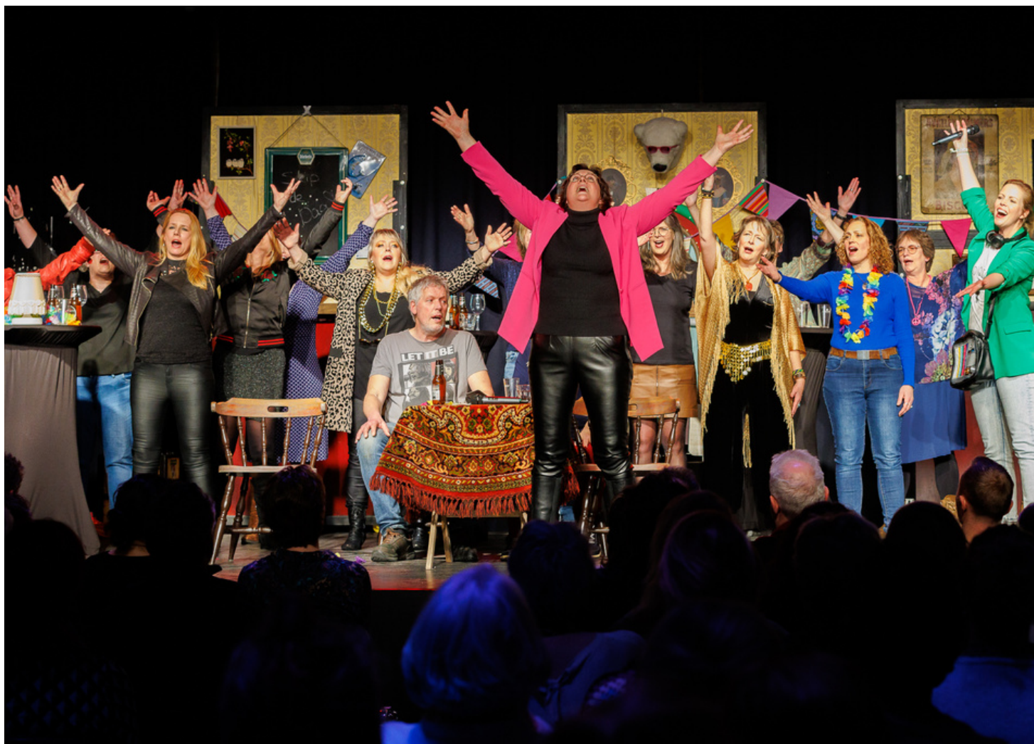
OP DE FOTO: THEATERKOOR TINT VOERDE 'RADIO TINT' TWEEMAAL UIT IN DE SERENADE.

Bezoekers van De Serenade genoten zaterdag en zondag 24 en zondag 25 februari met volle teugen van Radio Tint, een voorstelling van zestien verschillende nummers die verbonden werden door korte stukjes toneelspel.