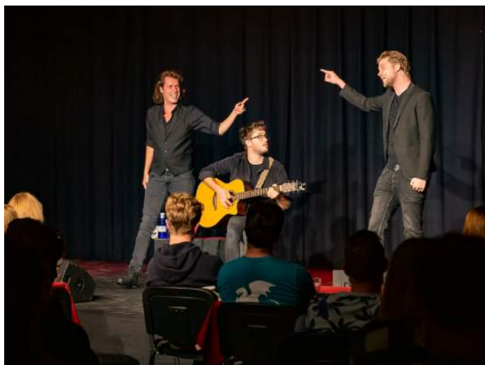
Optreden Jeroens Clan in september 2020 in De Serenade.